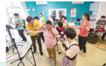
まるごとカフェ竣工式典記念ライブ「わいわい☆オールスターズ」

【事業内容】ユーアイファクトリーは、主に中度・重度の知的障害のある人が通所する日中活動の場です。創作活動、音楽活動、芸術活動、軽作業、外出、スポーツ、レクリエーションなど多様なプログラムを通して、自分の好きなことや、得意なことに取り組み、障害を個性として強みにできるような支援をします。