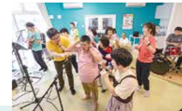
まるごとカフェ竣工式典記念ライブ「わいわい☆オールスターズ」

〔事業内容〕 ユーアイファクトリーは、主に中度・重度の知的障害のある人が通所する日中活動の場です。創作活動、音楽活動、芸術活動、軽作業、外出、スポーツ、レクリエーションなど多様なプログラムを通して、自分の好きなことや、得意なことに取り組み、障害を個性として強みにできるような支援をします。